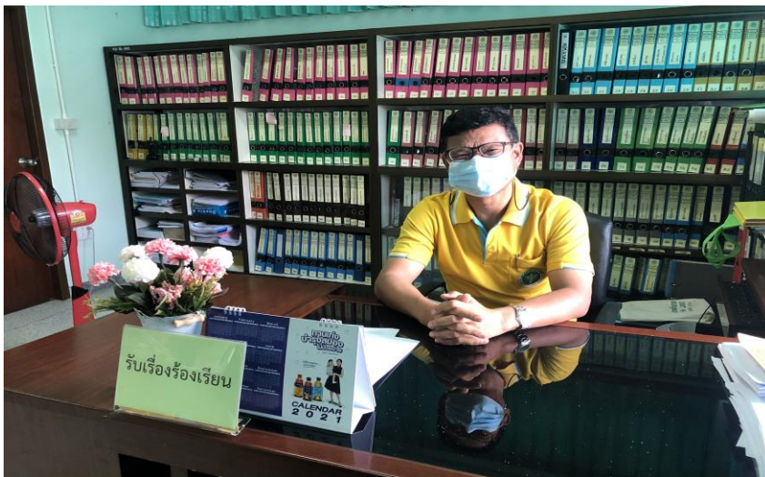
ยื่นข้อร้องเรียนด้วยตนเองกับเจ้าหน้าที่