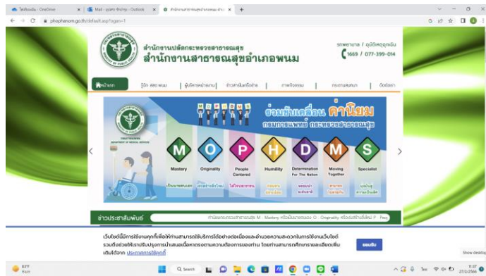
เว็บไซต์สำนักงานสาธารณสุขอำเภอพนม www.phophanom.go.th