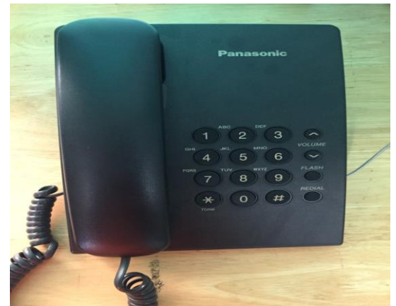
ร้องเรียนผ่านโทรศัพท์สำนักงาน เบอร์ ๐ ๗๗๓๙ ๙๐๑๔